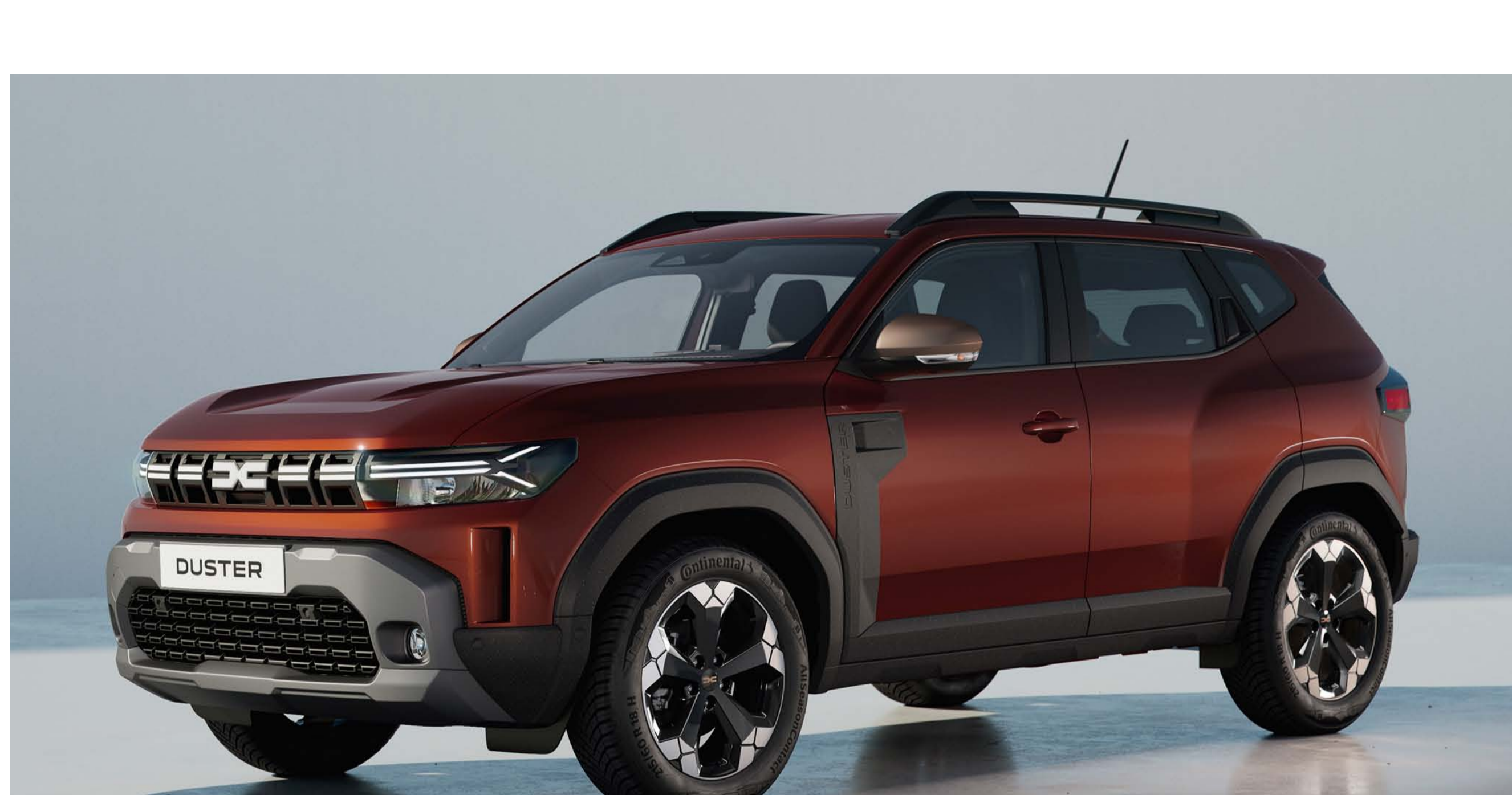
BRUN TERRACOTTA (1)