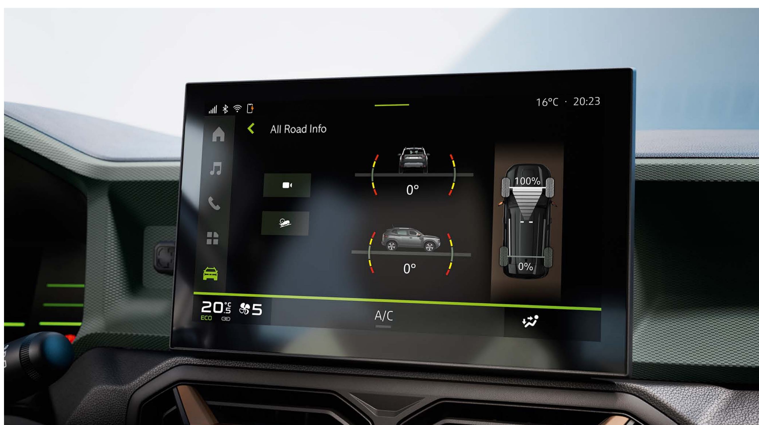
Écran tactile avec altimètre

Dans sa version 4x4, Nouveau Duster vous permettra d'affronter toutes les situations en un tour de main grâce à son nouveau sélecteur de mode de conduite ! Une garde au sol surélevée jusqu'à 217 mm, un angle d'attaque jusqu'à 31° pour escalader les pentes en transmission 4x4, des matériaux anti-rayures Starkle® : fidèle à son ADN de SUV, Nouveau Duster affiche d'excellentes capacités de franchissements.