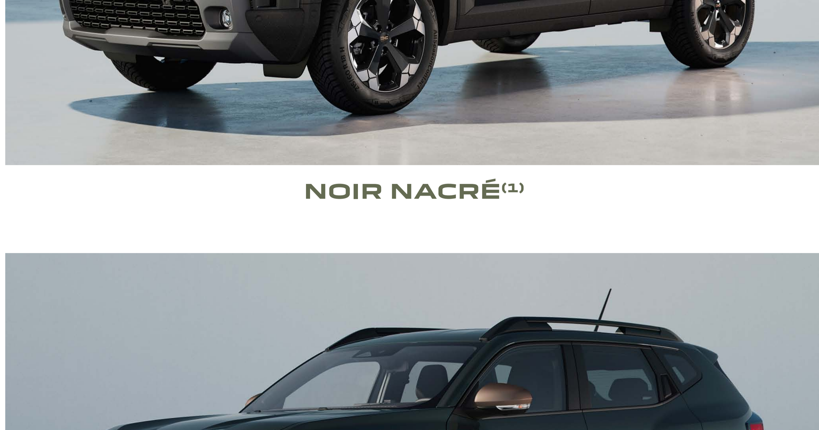
VERT CÈDRE (1)