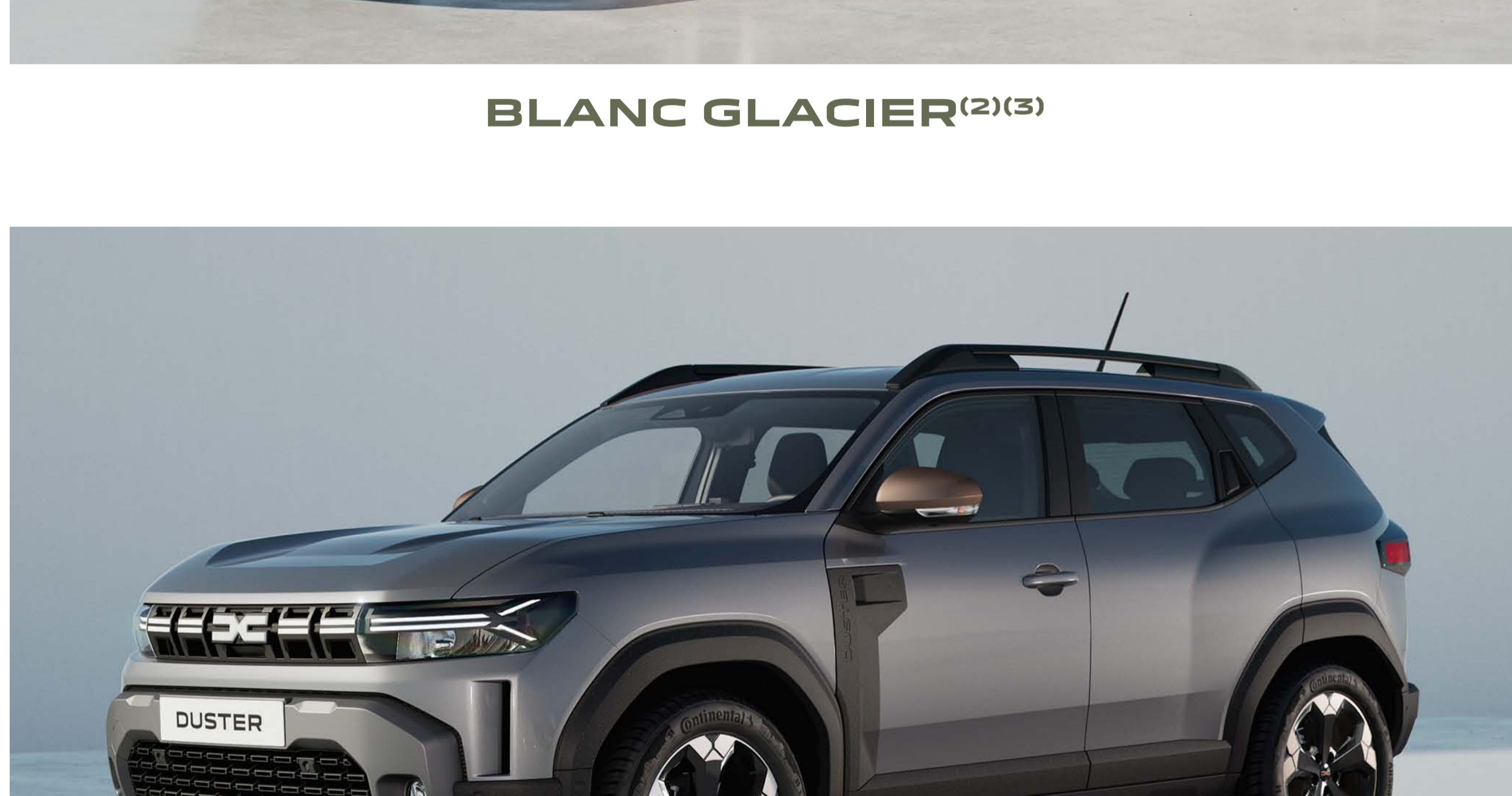
GRIS SCHISTE (1)(3)