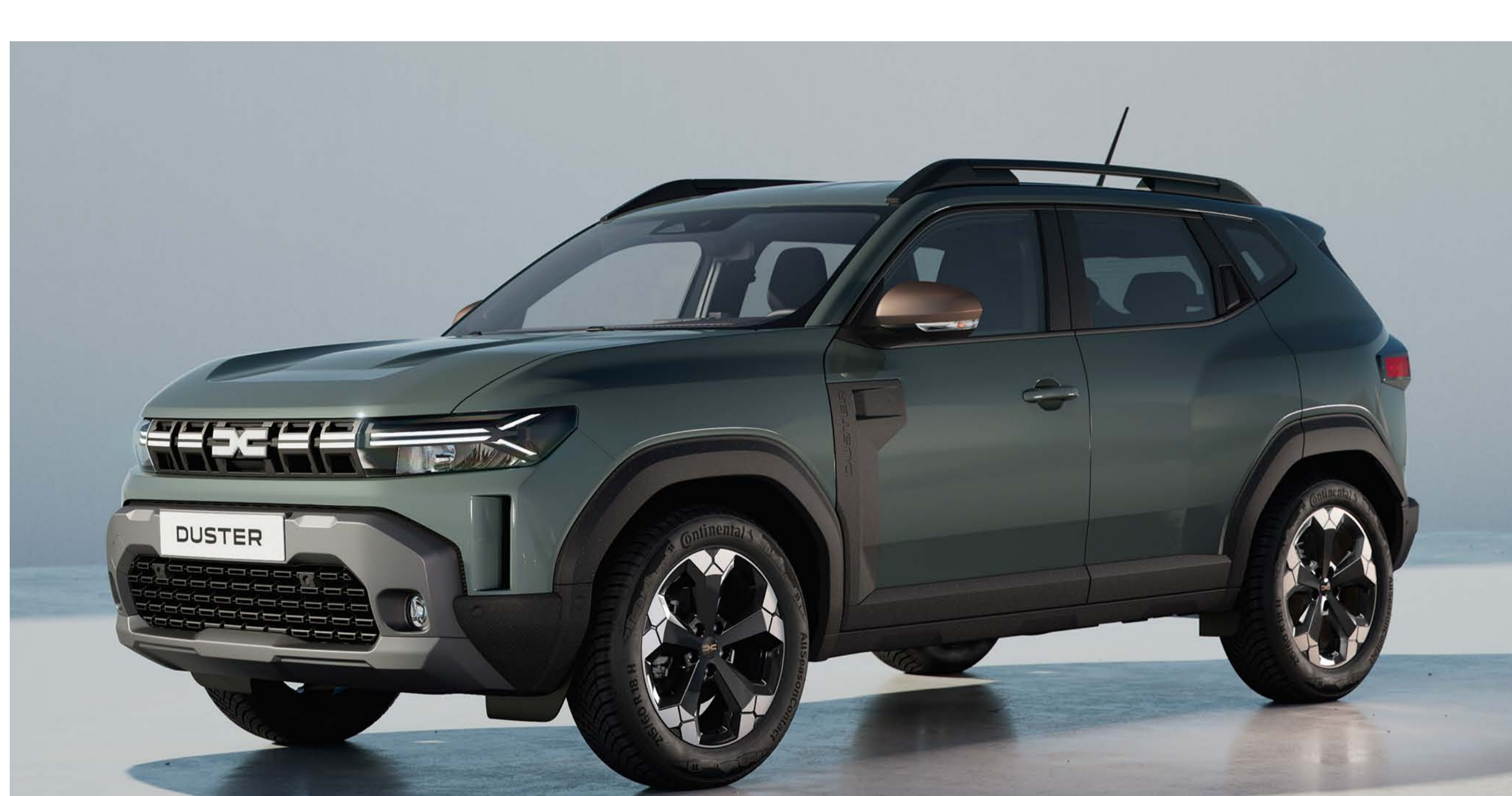
KAKI LICHEN (2)(3)