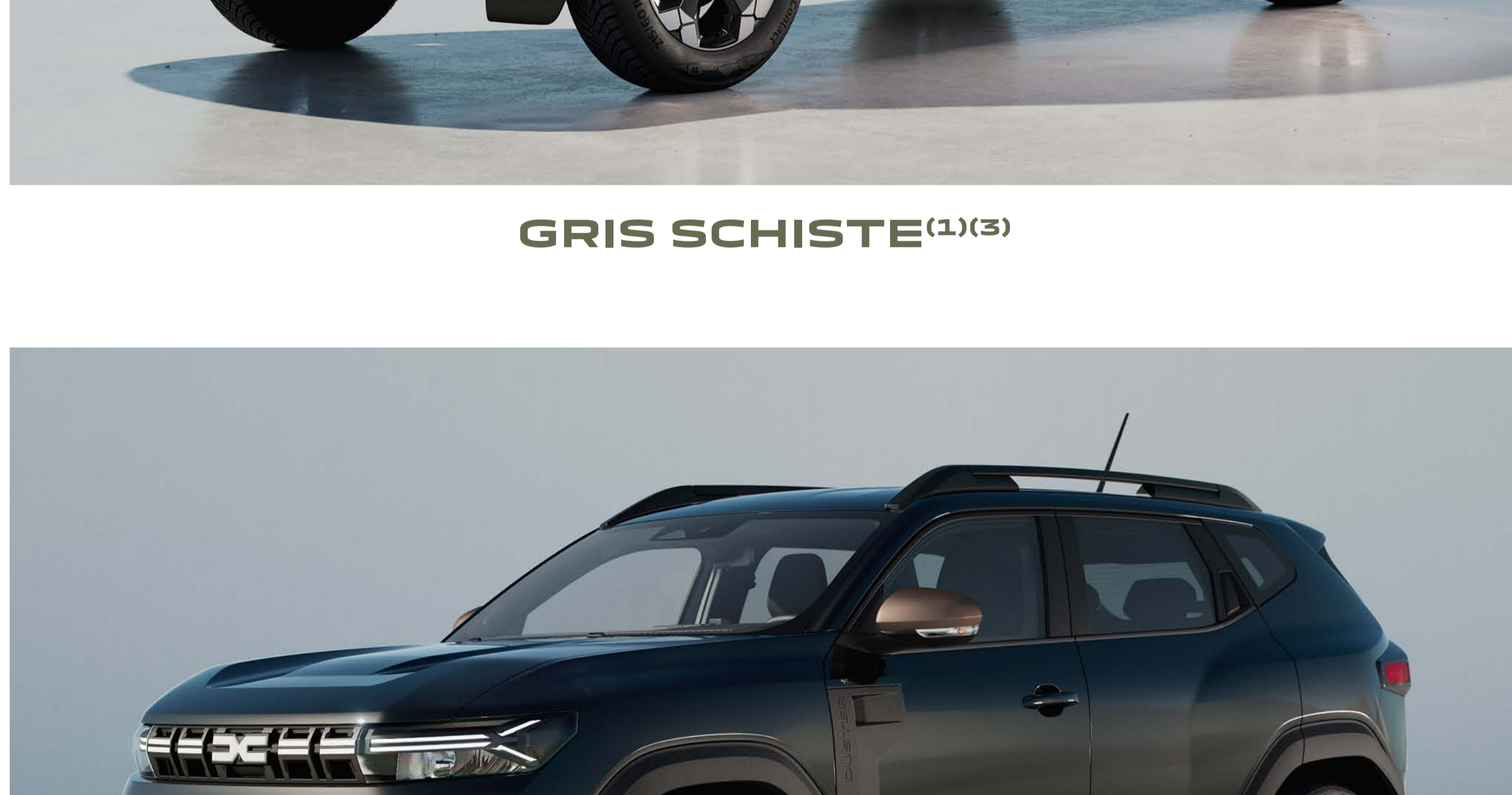
NOIR NACRÉ (1)