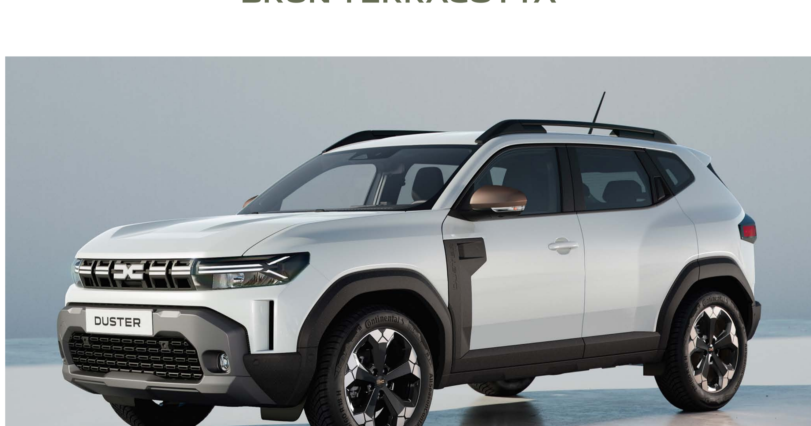
BLANC GLACIER (2)(3)