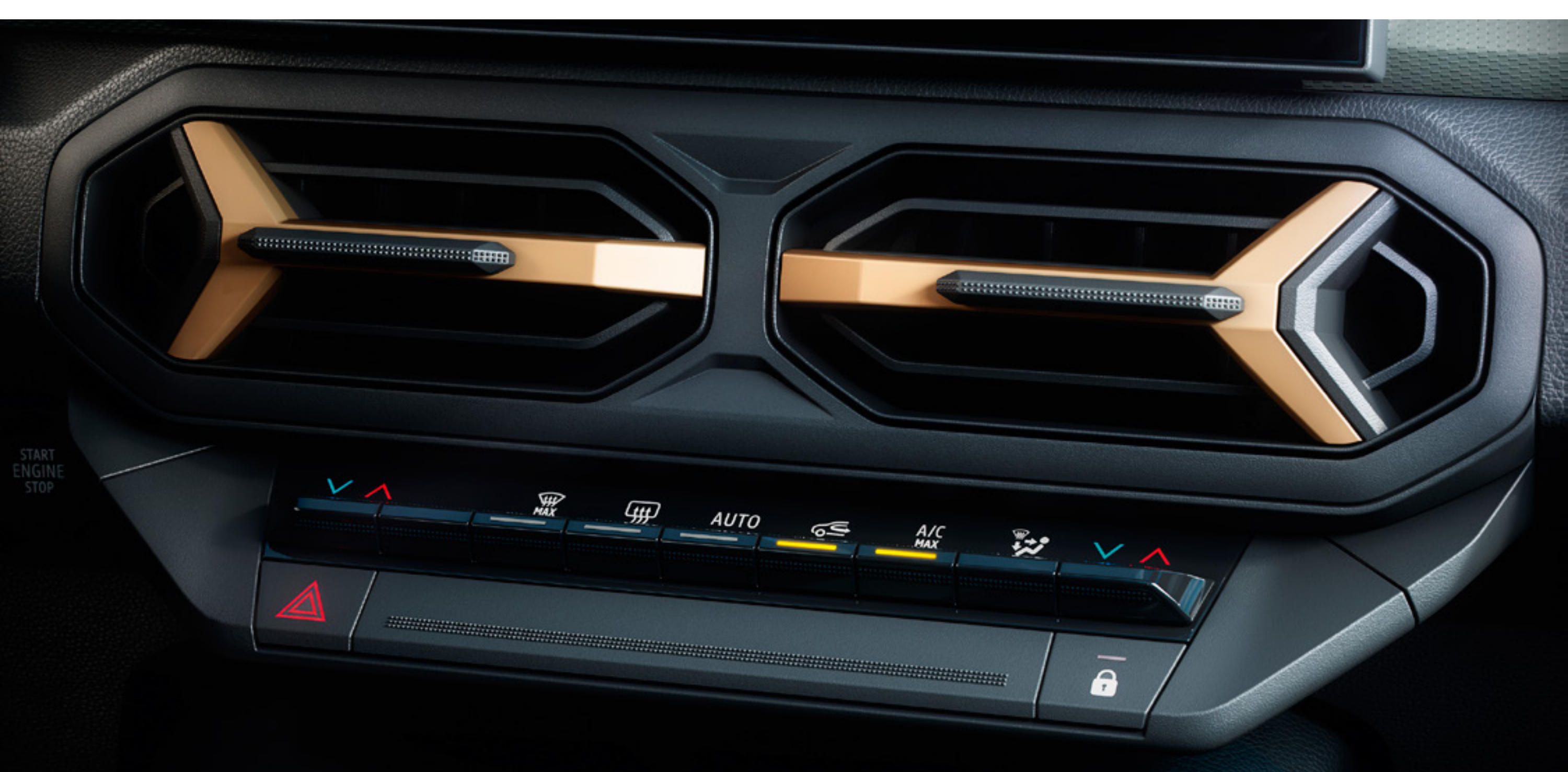
Automatyczny dwustrefowy układ ogrzewania i klimatyzacji

Wnętrze zaprojektowane dla pięciu osób jest skutecznie wyciszone i wyposażone w zestaw nagłośnienia Arkamys® 3D z sześcioma głośnikami. Komfort termiczny zapewnia automatyczna dwustrefowa klimatyzacja w przedniej części kabiny, z kratkami nawiewu dla pasażerów z tyłu.