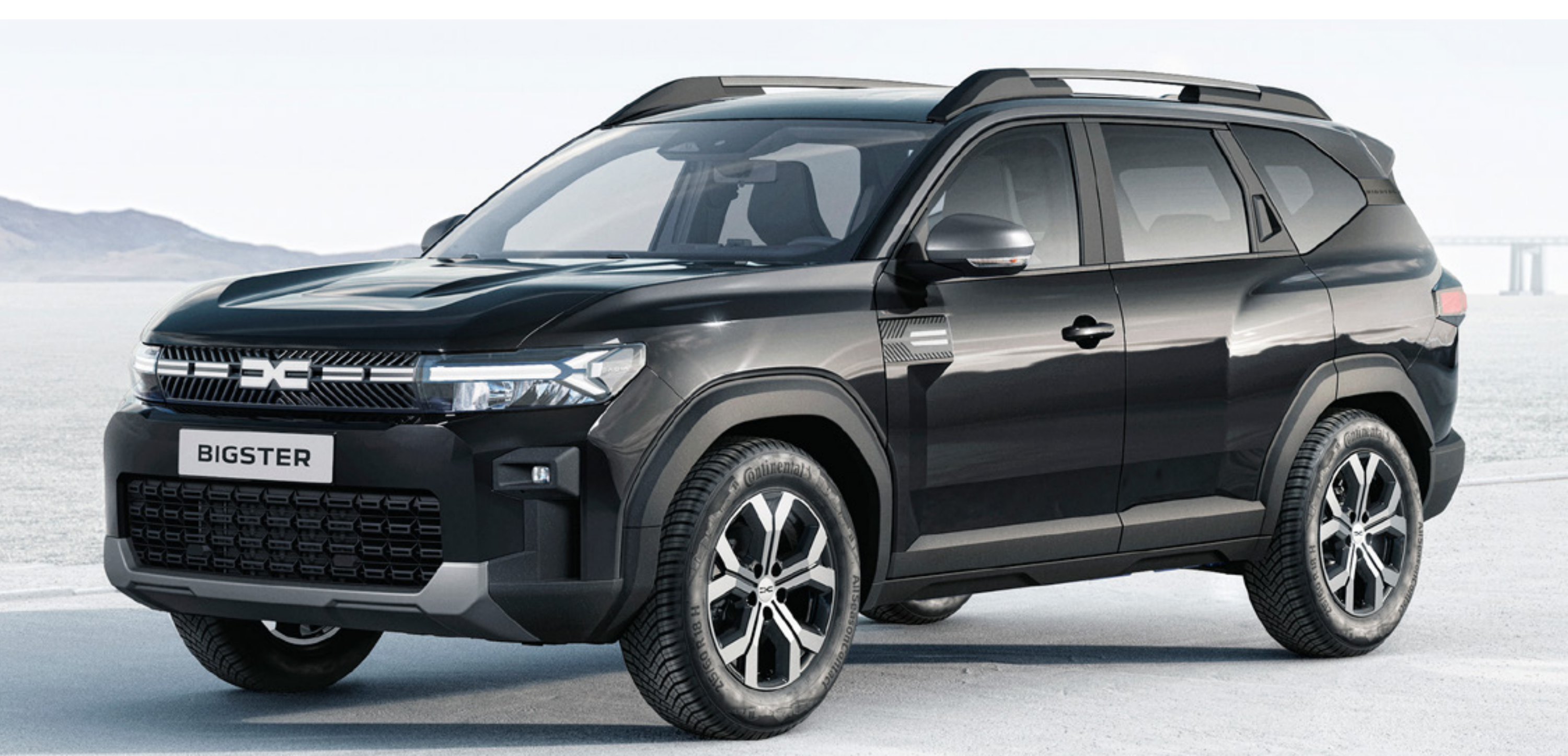
CZARNA PERŁA (2)