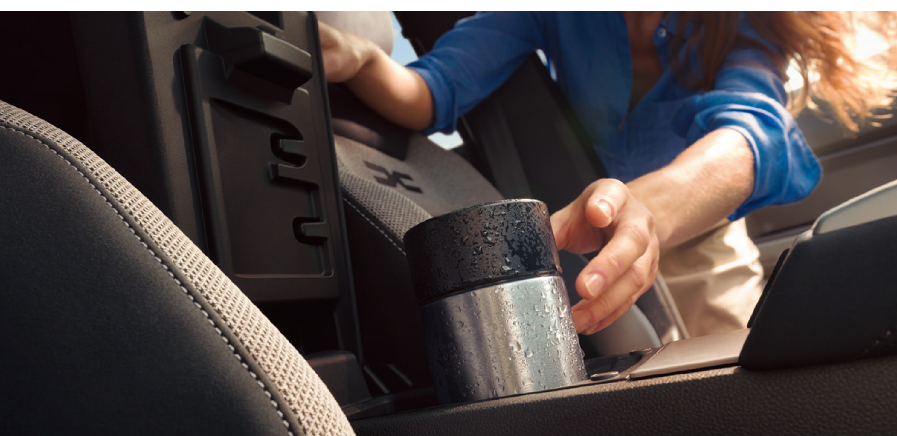
Chłodzony schowek w konsoli środkowej z przodu

YouClip to pomysłowy system pięciu standardowych punktów mocowania w całym wnętrzu. Można go uzupełnić o dwa dodatkowe punkty na prowadnicach zagłówek. Można do nich bezpiecznie przymocować różne przedmioty (telefon, tablet, uchwyt na napój itp.).