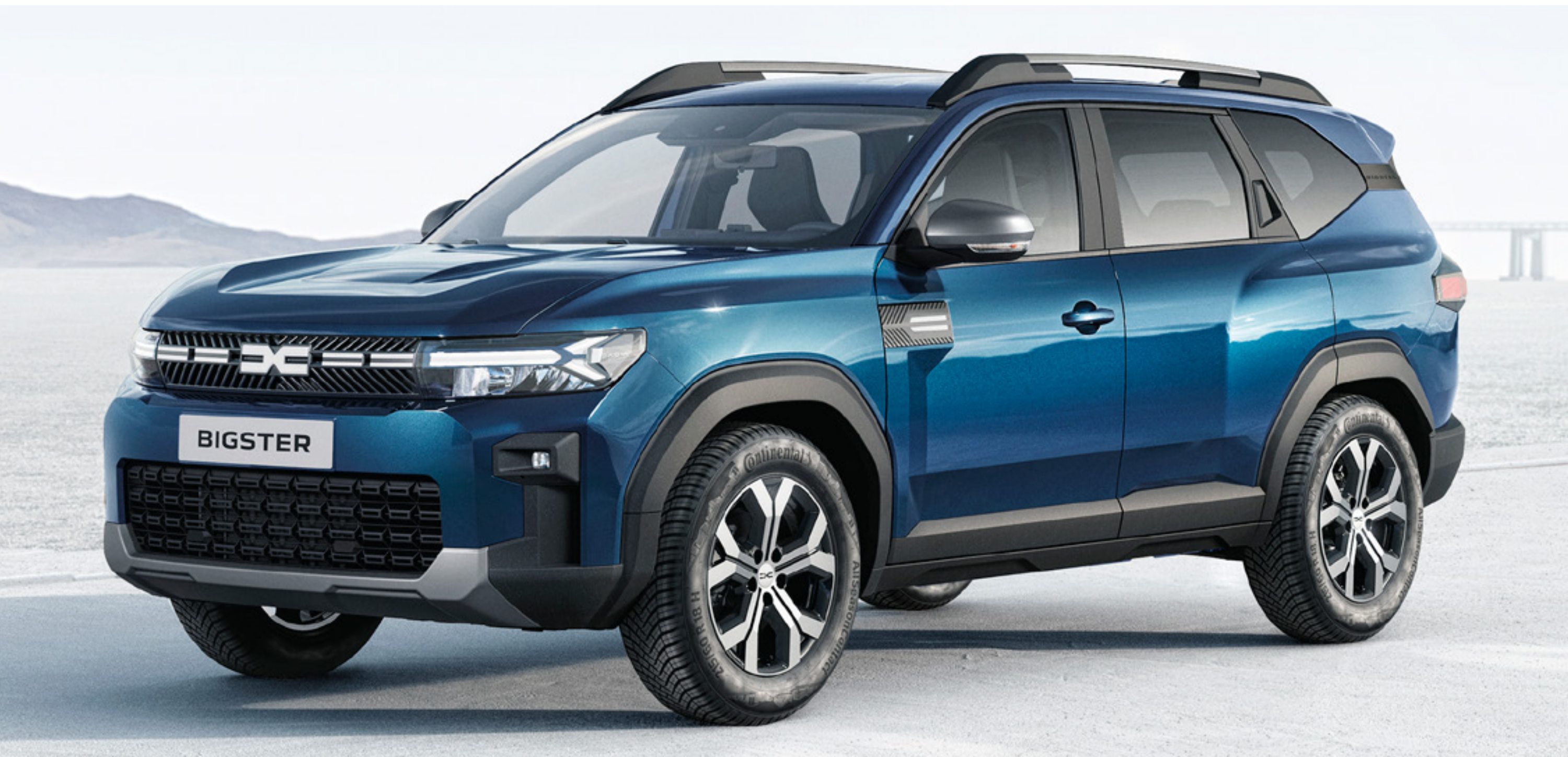
NIEBIESKI INDIGO (2)