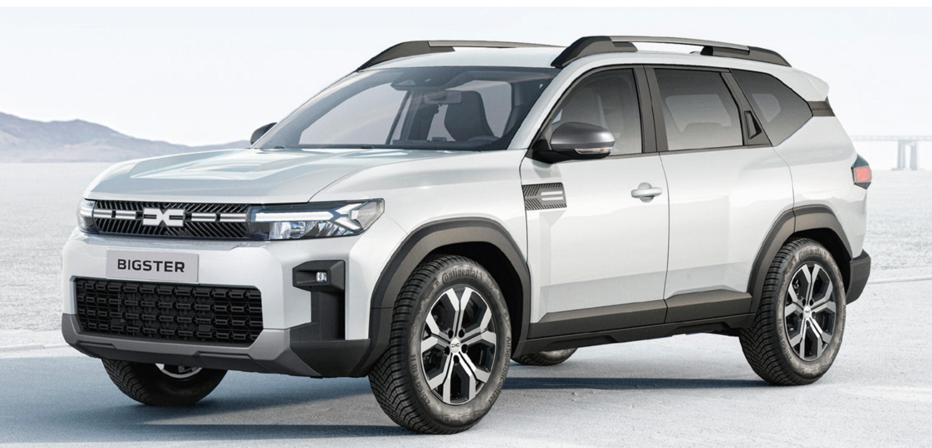
BIEL ALPEJSKA (1)