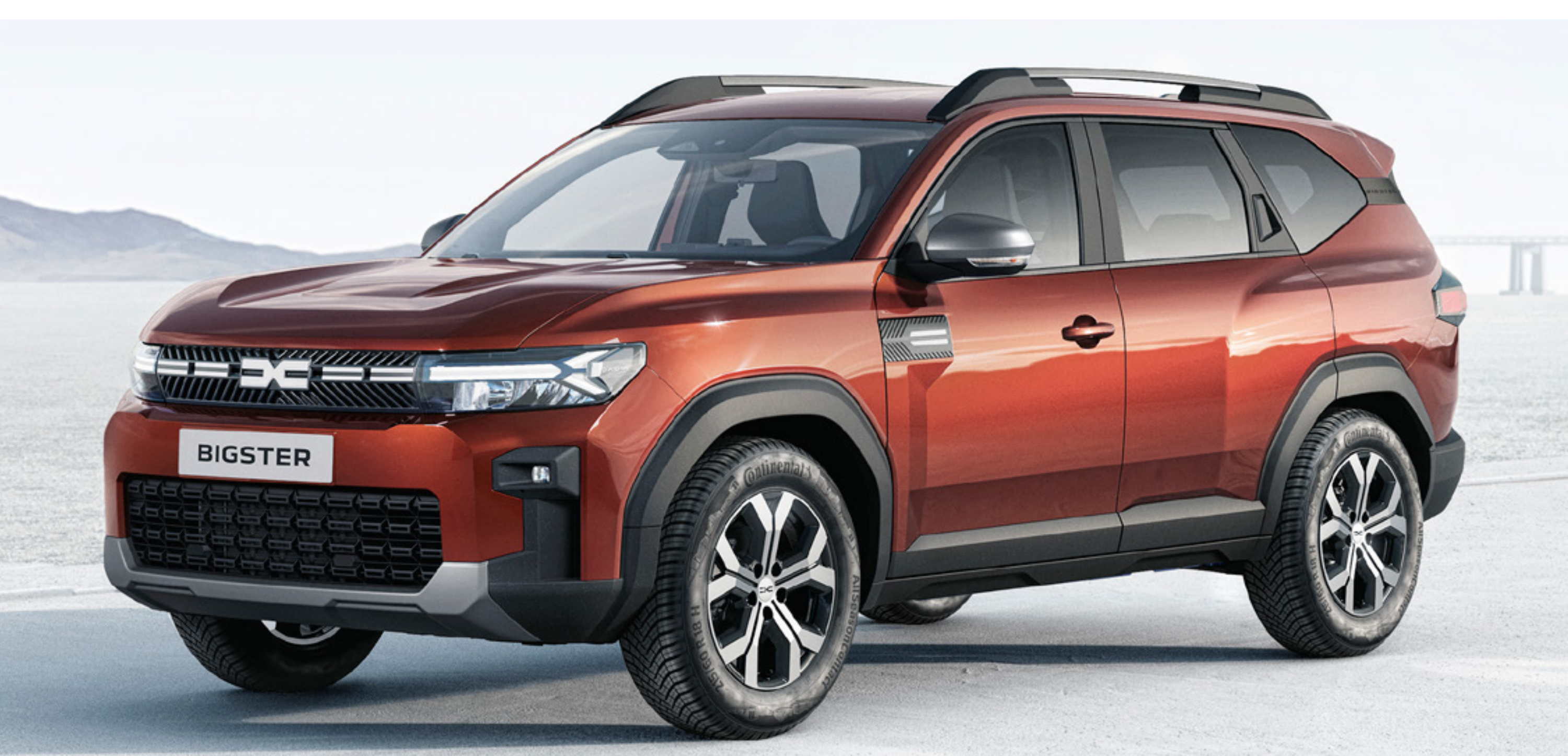
BRAZOWY TERRACOTA (2)