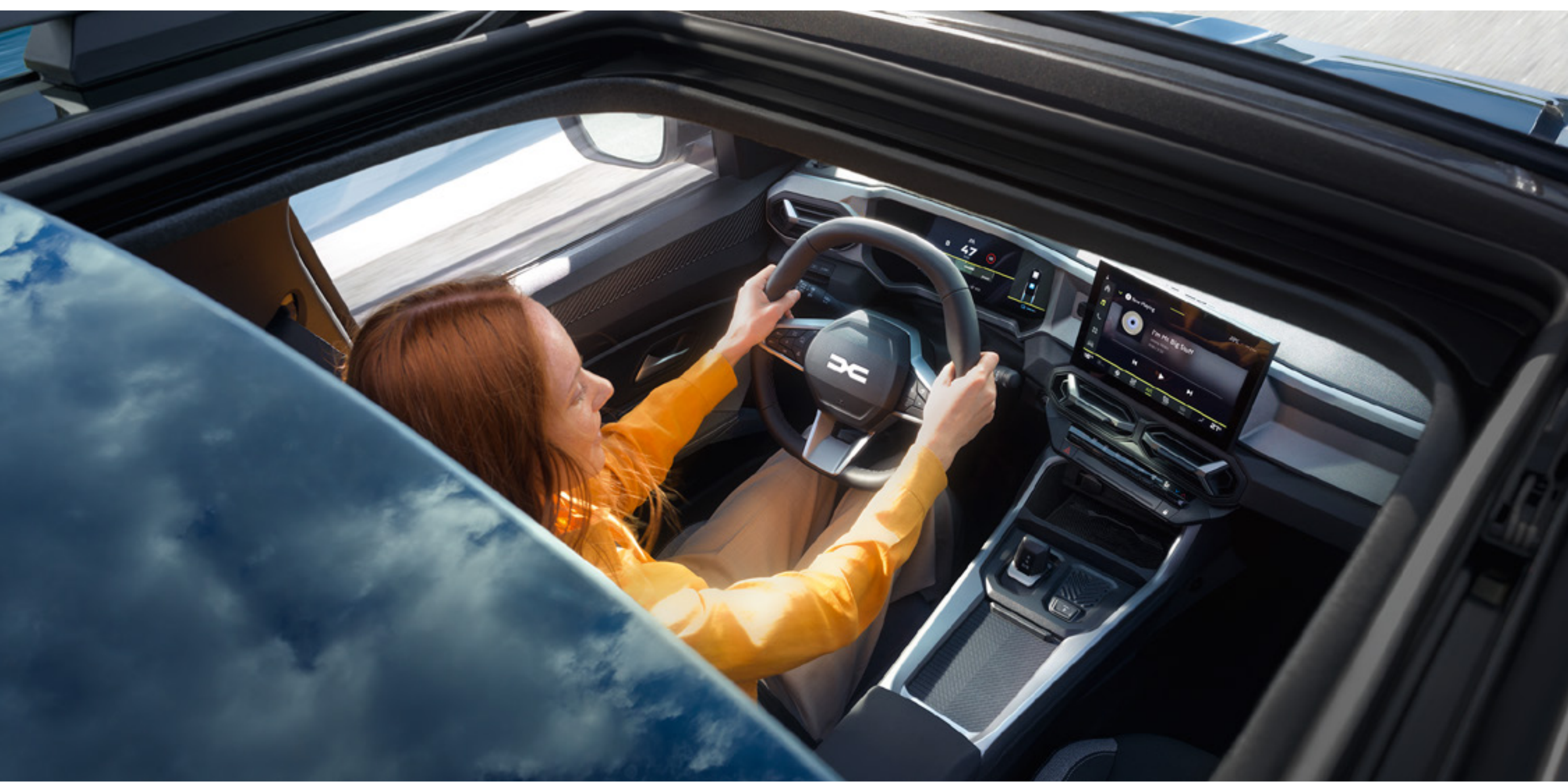
Panoramiczny otwierany szklany dach

Bigster z dwukolorowym nadwoziem prezentuje styl niewymuszonej elegancji. Panoramiczny otwierany szklany dach rozświetla wnętrze kabiny, a dodatkowym wyróżnikiem tej wersji jest specjalny lakier w kolorze niebieskim Indigo. Każdy znajdzie odpowiedniego Bigstera dla siebie.