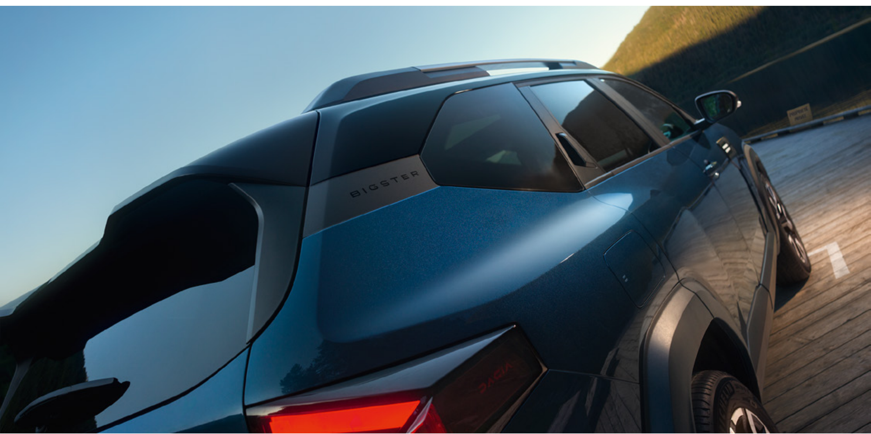
Ekskluzywne dwukolorowe nadwozie