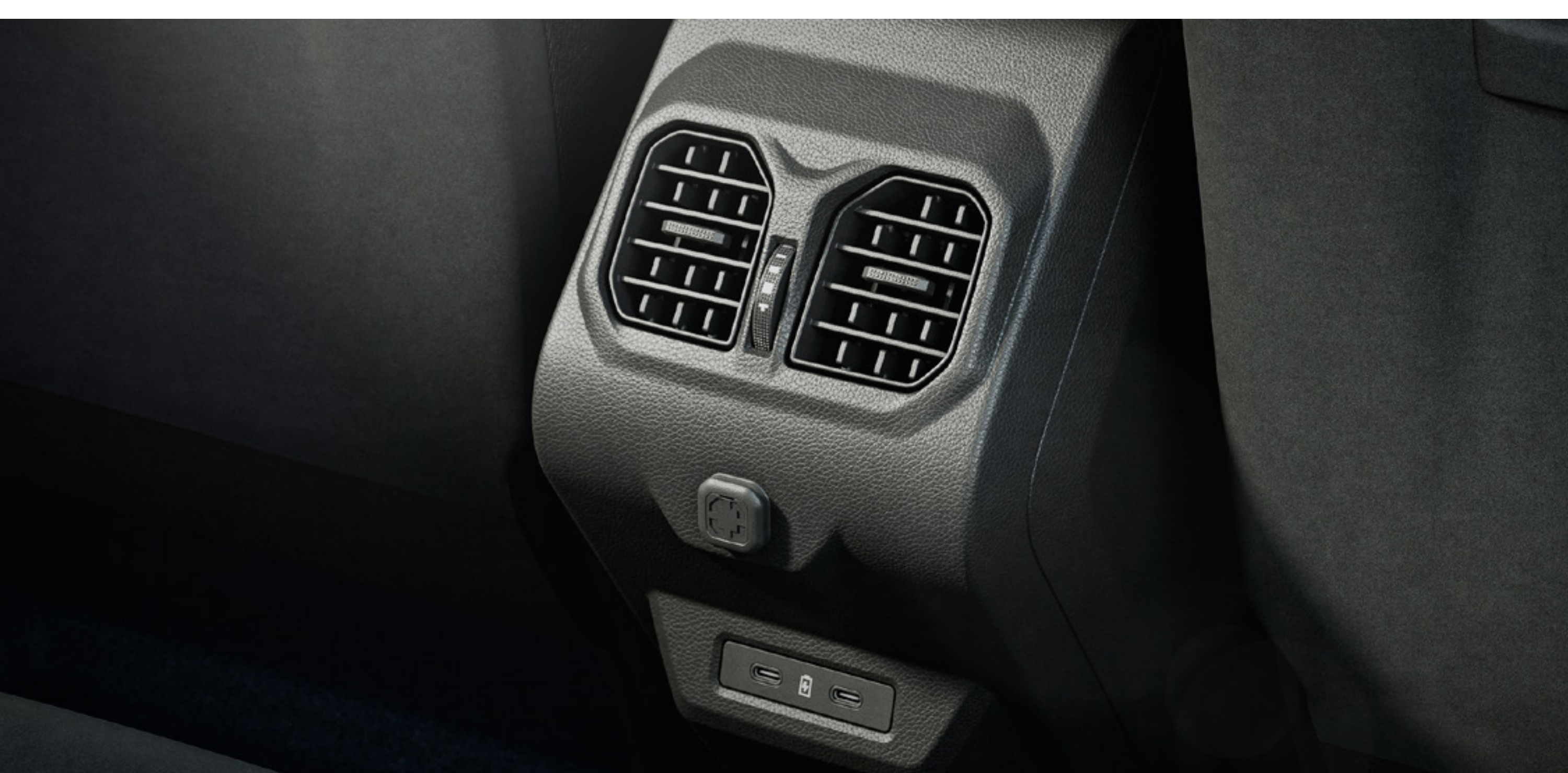
Tylne nawiewy w kabinie