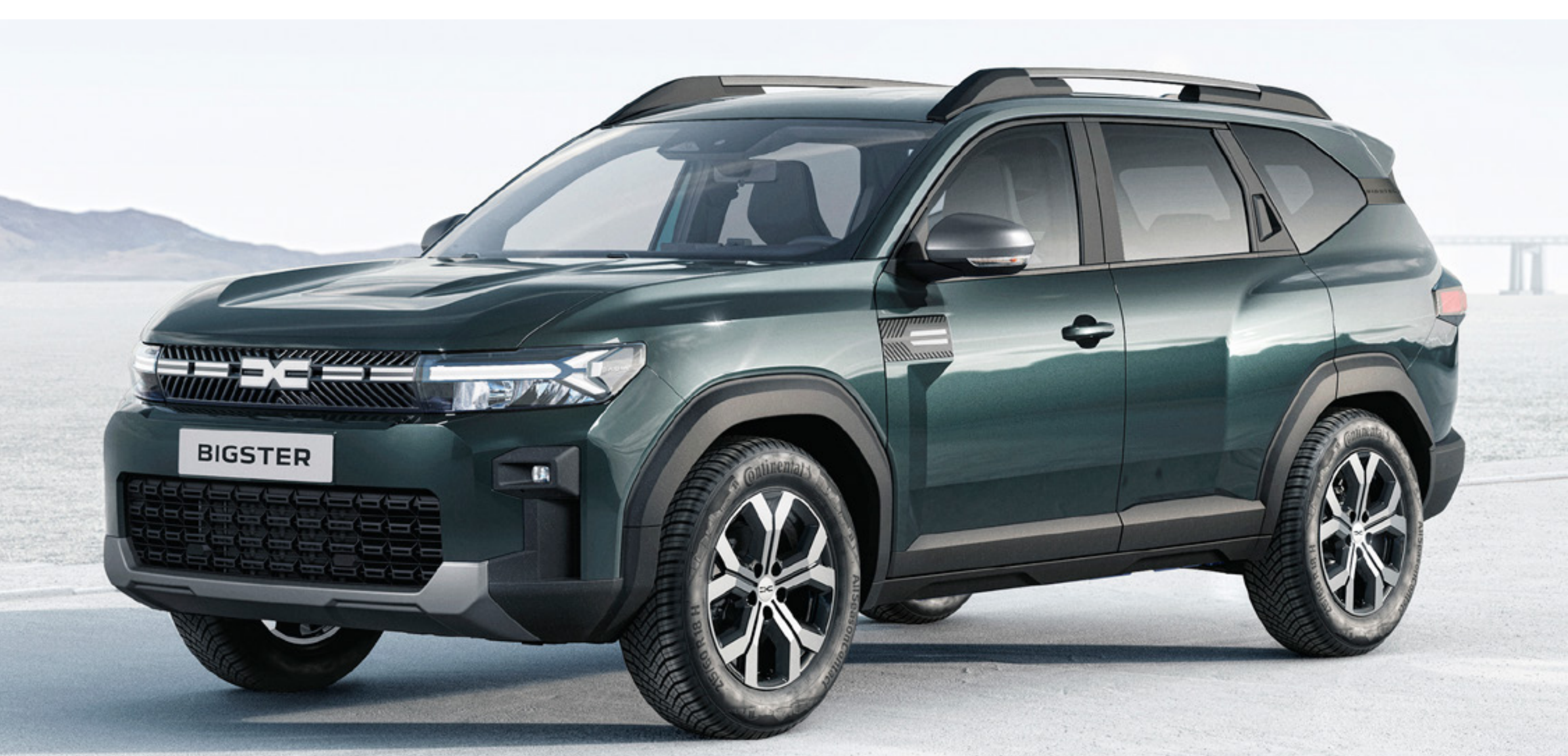
ZIELONY CEDAR (2)