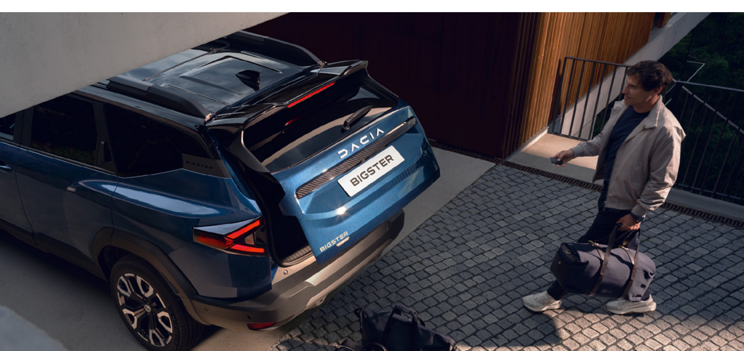
Elektrycznie otwierana kłapa bagażnika