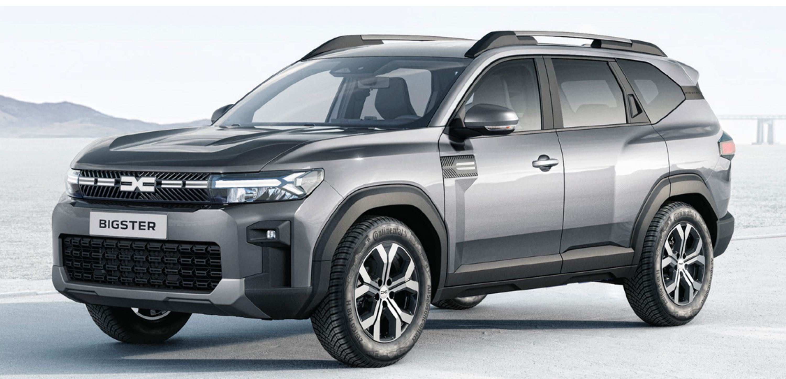
SZARY SCHIST (2)